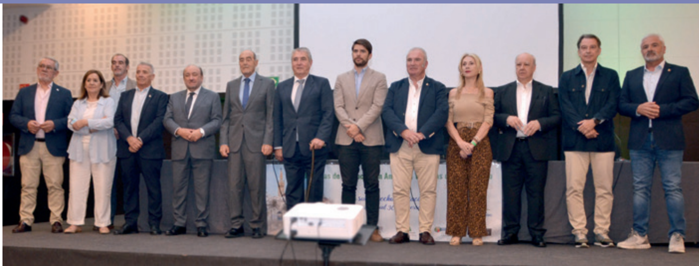
«Foto de familia» de representantes del colectivo de víctimas del terrorismo que acudieron al 30 cumpleaños de la AAVT