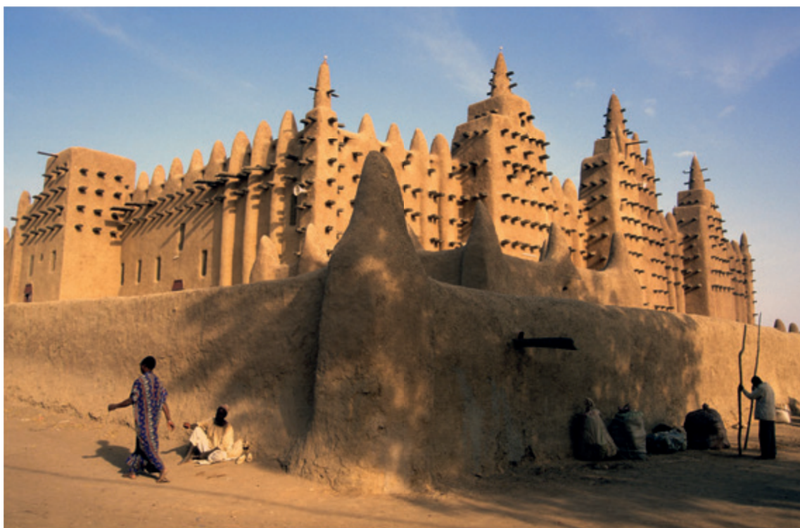
Gran Mezquita de Djenné, en Malí. El elemento religioso, incluso en su versión más radical, es tan sólo uno más en un complejo tapiz de factores económicos, sociales, geopolíticos e históricos y, en general, de falta de expectativas de vida que asolan a esta región.