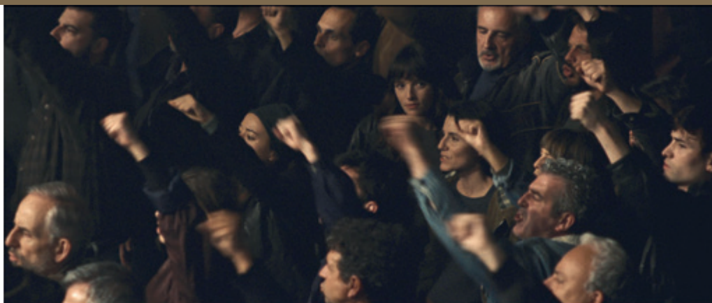
La película nos pide una alerta y compromiso máximo con lo que estamos viendo.

nuevos cuadros dirigentes. El conjunto ofrece una visión interpretativa del mundo etarra que funciona, no como un documental, pero sí como una creación ficticia muy bien documentada.