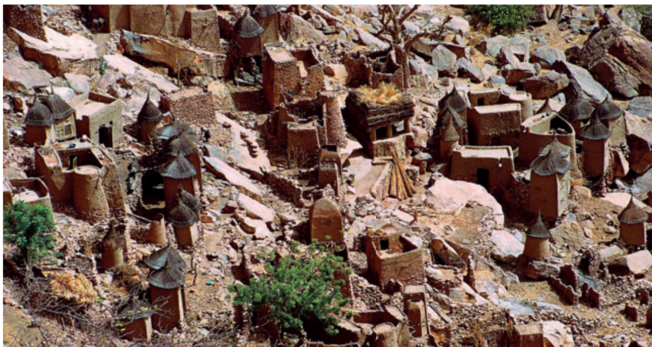
Pueblo en el acantilado de Bandiagara, en el País Dogón, Malí.